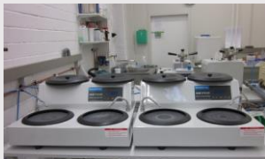
Schleif - Poliergeräte manuell